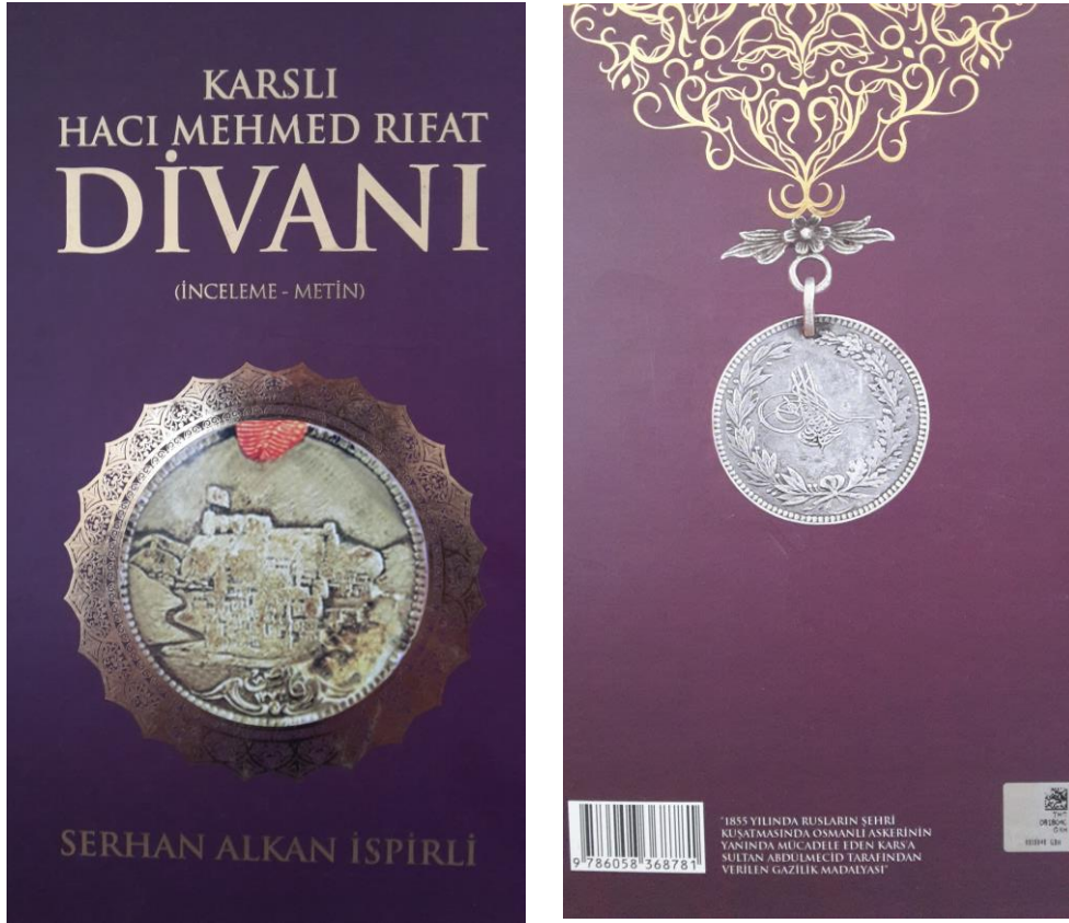
Karşlı Hacı Mehmed Rifat Divanı (İnceleme-Metin) adlı eserin kapak görüntüsü

Bir inceleme ve metin çalışması olan Karşlı Hacı Mehmed Rifat Divanı adlı eser, altı bölümden meydana gelmektedir. Eserin konusunu Rifat Divanı oluşturmaktadır ve Rifat Divanı'nın metin kısmının inşasında Millî Kütüphane Yazmalar Koleksiyonu'nda 06 Mil Yz. FB 234 arşiv numarasıyla kayıtlı metin dikkate alınmıştır. Çalışmada ifade edildiğine göre şaire ait yine Milli Kütüphane'de 06 Mil Yz Cönk 118, 06 Mil Yz Cönk 136 ve 06 Mil Yz Cönk 143 numara ile kayıtlı cönklerde bir kısım manzumeler tespit edilmiştir.