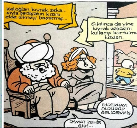
Paylaşım: 7 (URL-7)

Keloğlan'ın gelenekteki fiziki ve karakteristik özelliklerinin korunduğu yukarıdaki paylaşımlara bakıldığında hem kel hem de zeki ve kurnaz olduğu özellikle vurgulanmakta; padişahın kızı ile evlenebilmek için zekâsını kullandığı ifade edilmektedir. Paylaşım 6'da Keloğlan'ın zekâsı, basit şekiller yapabilmesiyle ölçülmekte iken Paylaşım 7'de ise kıvrak zekâsı sayesinde önce padişahın kızı ile evlenebildiği, evlilikten sıkılınca da yine zekâsını kullanarak kızdandı belirlenmektedir. Bunun yanında padişahın, kızını vermek için Keloğlan'ı sınaması ve ejderha öldürmek gibi masal metinlerine ait motiflerin paylaşımlarda korunması dikkati çeken durumlardandır.