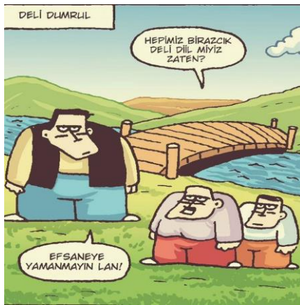
Paylaşım: 13 (URL-14)

Sanal kültür ortamında güncellenen ve mizahi bir hüviyet ile anlık görsellik kazandırılan Deli Dumrul, sosyal medya başta olmak üzere internet ortamlarında paylaşılp adeta yeniden yaratılmaktadır: