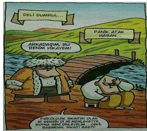
Paylaşım: 14 (URL-15)

Paylaşım 13 ve 14'e bakıldığında Dumrul'un “deli” sıfatı, gelenekteki “alp/yiğit tipi” yerine “psikolojik sorunları olan insan” şeklinde yorumlanmış ve köprüünün başında bekleme