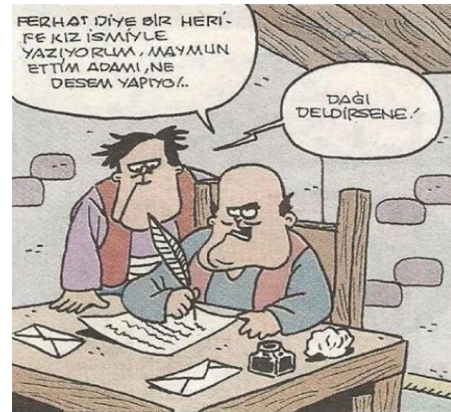
Paylaşım: 19 (URL-21)