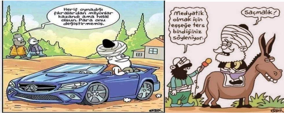
Paylaşım: 4 (URL-4)

Nasreddin Hoca'nın göle maya çaldığı epizodu ihtiva eden fıkraya atıflarda bulunulan yukarıdaki paylaşımlara bakıldığında Hoca'nın söz konusu eylemi, sosyal medya paylaşımcılarının fıkra ile ilgili bazı düşüncelerini ifade etmektedir. Nitekim Paylaşım 1'de Hoca'nın göle maya çalmak gibi anlamsız olarak algılanan hareketi, paylaşım yapanlar ve bu paylaşımı beğenen sosyal medya kullanıcıları tarafından mantıklı bir sonuca bağlanmış ve herkesin yadırgadığı Hoca, nihayetinde bir yoğurt fabrikası kurarak zengin olmuştur. Paylaşım 2'de ise Nasreddin Hoca fıkralarının mantığına uygun olarak gölün oruçlu olabileceği fikri ortaya çıkmış ve "Ya tutarsa" sözü Hoca'nın aksine sıradan bir insana söylenmiştir. Bu durumda da şaşkınlık yaşayan kişi Nasreddin Hoca olmuştur. Paylaşım 3'te de maya göle değil çöle çalınmaktadır. Göle maya çalma eyleminin getirdiği absürtlük daha da ileriye götürülmüş ve Hoca, gölün aksine içinde su bulunmayan çöle maya çalmaya çalışmaktadır. Kendisine bu durum hatırlatılsa da Hoca, deney yaptığını ifade etmektedir. Bunun yanında Paylaşım 2 ve 3'te hazırcevaplık özelliğinin Hoca'nın aksine sıradan insanlara verilmesi geleneğe ters düşmekte ve bu durum da paylaşımlara ayrı bir mizah katmaktadır.