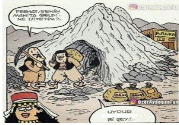
Paylaşım: 20 (URL-22)