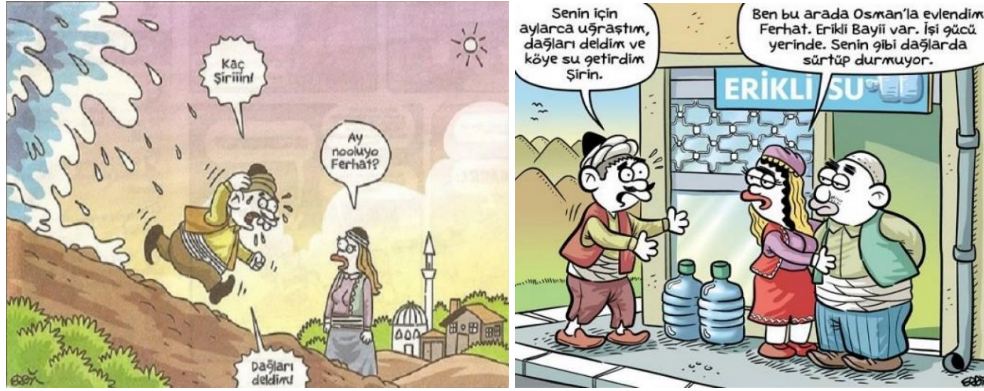
Paylaşım: 24 (URL-26)

Ferhat'ın dağı delme eylemini nasıl gerçekleştirdiğini tasvir eden yukarıdaki paylaşımlar da diğerleri gibi günümüz bağamlarına uyarlanmış, mizah unsuru bu şekilde ortaya çıkmıştır. Paylaşım 21'de Ferhat, Şirin için dağı delmekte; fakat bir yandan da Şirin'in, cep telefonuna gönderdiği kısa mesajlara cevap vermeye ve kıskançlıklarına katlanmaya çalışmaktadır. Paylaşım 22'de ise Ferhat, dağı duvar delme aleti ile delmekte ve Şirin de o esnada elektrikli süpürge ile tozları almaktadır. Paylaşım 23'te de Ferhat, aşkı için dağları deldiği haberini Şirin'e yol çalışması olduğunu işaret eden bir trafik levhası ile ifade etmeye çalışmaktadır.