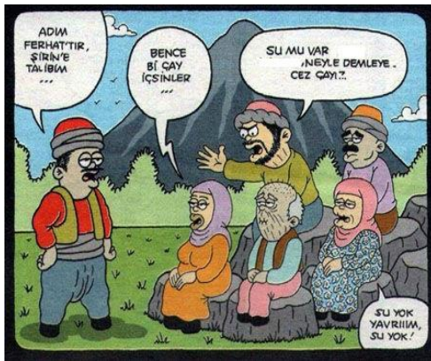
Paylaşım: 18 (URL-20)

Yazılı, sözlü ve elektronik kültür ortamlarında güncellenen Ferhat ile Şirin hikâyesine bağlı olarak yeniden yaratılan Ferhat, sanal kültür ortamlarında da yerini almış ve "dağ delme" motifi korunarak çeşitli paylaşımlara konu olmuştur: