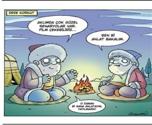
Paylaşım: 8 (URL-9)