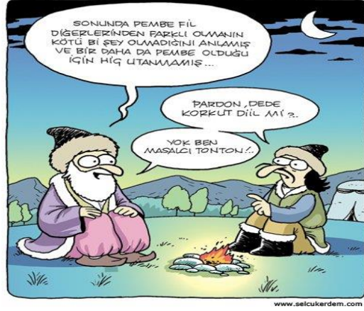
Paylaşım: 12 (URL-13)

Paylaşım 11 ve 12’de ise Dede Korkut’un ismine dikkat çekilmek istenmiştir. Gelenekte Dede Korkut, doğumu esnasında insanlara korku vermiş ve efsanelere göre “Korkut” adını alması tesadüf olmamıştır. Hakkında anlatılan bir efsaneye göre Dede Korkut, torbaya benzer bir yığıntının içinde doğmuştur. Bunu gören insanlar da korkudan kaçışmış ve annesi ona “Korkut” adını vermiştir. Başka bir efsaneye göre ise üç yıl anne karnında kalan Korkut, doğduğunda dünya üç gün üç gece karanlığa bürünmüş; fırtınalar kopmuş ve dağları, nehirleri kapkara bir duman kaplamıştır. Bu durum karşısında dehşete kapılan insanlar, çocuğa “Korkut” adını vermişlerdir (Bayat, 2003, s. 32-33). Paylaşımlara bakıldığında da Dede Korkut’un insanları korkuttuğu, korkutmaya çalıştığı ya da fonksiyonunun korkutmak olduğu gibi izlenimler verilmiştir. Fakat söz konusu paylaşımlarda Dede Korkut’un korkutma işlevini gelenektekinin aksine doğumu esnasında değil ihtiyarlığında yerine getirdiği ifade edilmeye çalışılmaktadır. Nitekim Paylaşım 11’de korkutma eyleminin “Böö” nidası olduğu belirtilirken Paylaşım 12’de ise söz konusu eylemin “korkutucu masal/hikâye” ile gerçekleşmesi gerektiği vurgulanmaktadır. Bunun yanında, Paylaşım 12’de Dede Korkut’un gelenekteki gibi olmasa da insanlara korkunç masallar anlatan bir hikâye anlatıcısı olduğu yinelenmektedir.