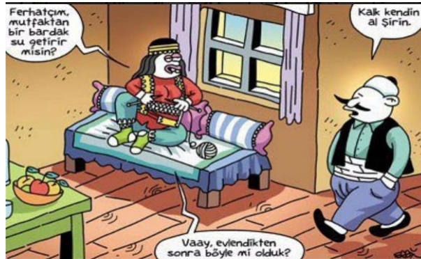
Paylaşım: 26 (URL-28)