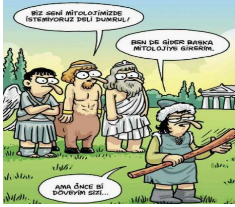
Paylaşım: 15 (URL-16)

davranışı da bu duruma bağlanmıştır. Hatta karikatürlere mizah katmak için yerleştirilen ve hikâyeye dâhil olma isteğinde bulunduğu ifade edilen sıradan kişilerin de “delilik” olgusuna paralel olarak “panik atak” ve “birazcık deli” oldukları vurgulanmıştır.