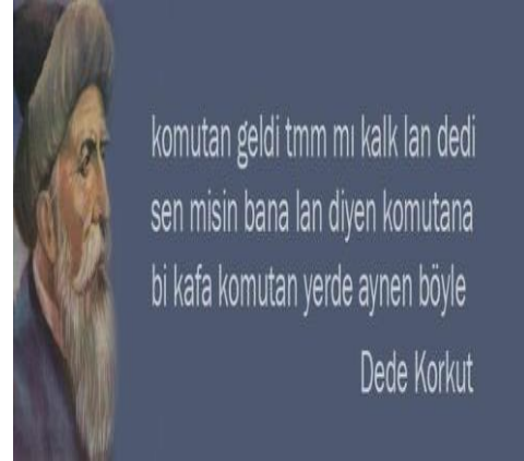
Paylaşım: 9 (URL-10)