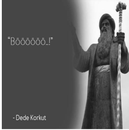
Paylaşım: 11 (URL-12)