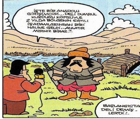
Paylaşım: 17 (URL-18)

Paylaşım 15 ve 16'da da Dumrul'un akıl sağlığının yerinde olmadığı yönünde göndermeler bulunmaktadır. Paylaşım 15'te Dumrul, Yunan mitolojisine dâhil olmak istemekte, fakat “akli dengesi bozuk” olduğu için kabul edilmemektedir. Bu yüzden de kendisine yakıştırılan “deli” sıfatına uygun olarak Yunan mitolojisine ait kahramanları dövme istemektedir. Paylaşım 16'da ise Dumrul, geleneksel rolünün aksine bu kez köprüden geçmek isteyenleri geri çevirmekte ve yanına Yüzüklerin Efendisi filminin karakteri Gandalf'ı da alarak, bir başka deyişle, “deli” olduğunu ispat etmektedir.