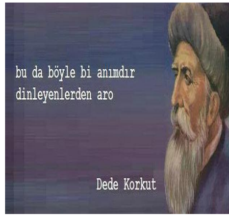
Paylaşım: 10 (URL-11)

Paylaşımlar incelendiğinde görülmektedir ki gelenekte boy boylayıp soy soylayan, geçmişten hikâyeler anlatan Dede Korkut, sanal kültür ortamlarında da aynı özelliğini korumakta ve sosyal medya kullanıcılarının zihninde hikâye anlatma fonksiyonunu muhafaza etmektedir. Paylaşım 8’de Dede Korkut, aklında çok güzel hikâyeler olduğunu ve film çekmek istediğini bir arkadaşına anlatmaktadır. Paylaşım, on iki hikâyenin, arkadaşının sözünde durmayarak herkese anlatması sonucunda yayıldığını ifade etmekte ve bu durumu geleceğe aykırı olarak mizahi bir biçimde ele almaktadır. Paylaşım 9’da ise hikâyelerin olağanüstülüğüne bir gönderme yapılarak Dede Korkut’un palavracı bir hikâye anlatıcısı olduğu, günümüz askerlik anılarını abartarak anlatan kişilere benzediği vurgulanmaktadır. Paylaşım 10’da da Dede Korkut’un hikâye anlatıcı kimliği korunmuş ve hikâyelerde vakanın merkezinde olduğu sahnelerle gönderme yapılarak anısını anlatan sıradan bir insana benzetilmiştir.