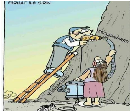
Paylaşım: 22 (URL-24)