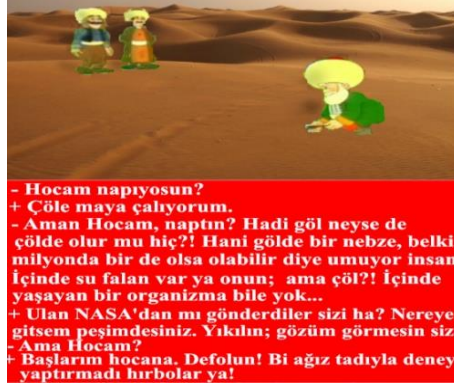
Paylaşım: 3 (URL-3)

Nasreddin Hoca'nın göle maya çaldığı epizodu ihtiva eden fıkraya atıflarda bulunulan yukarıdaki paylaşımlara bakıldığında Hoca'nın söz konusu eylemi, sosyal medya paylaşımcılarının fıkra ile ilgili bazı düşüncelerini ifade etmektedir. Nitekim Paylaşım 1'de Hoca'nın göle maya çalmak gibi anlamsız olarak algılanan hareketi, paylaşım yapanlar ve bu paylaşımı beğenen sosyal medya kullanıcıları tarafından mantıklı bir sonuca bağlanmış ve herkesin yadırgadığı Hoca, nihayetinde bir yoğurt fabrikası kurarak zengin olmuştur. Paylaşım 2'de ise Nasreddin Hoca fıkralarının mantığına uygun olarak gölün oruçlu olabileceği fikri ortaya çıkmış ve "Ya tutarsa" sözü Hoca'nın aksine sıradan bir insana söylenmiştir. Bu durumda da şaşkınlık yaşayan kişi Nasreddin Hoca olmuştur. Paylaşım 3'te de maya göle değil çöle çalınmaktadır. Göle maya çalma eyleminin getirdiği absürtlük daha da ileriye götürülmüş ve Hoca, gölün aksine içinde su bulunmayan çöle maya çalmaya çalışmaktadır. Kendisine bu durum hatırlatılsa da Hoca, deney yaptığını ifade etmektedir. Bunun yanında Paylaşım 2 ve 3'te hazırcevaplık özelliğinin Hoca'nın aksine sıradan insanlara verilmesi geleneğe ters düşmekte ve bu durum da paylaşımlara ayrı bir mizah katmaktadır.