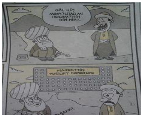
Paylaşım: 1 (URL-1)

Nasreddin Hoca'nın güncellendiği ve sanal kültür ortamında yeniden yaratıldığı paylaşımların birkaçı aşağıdaki gibidir: