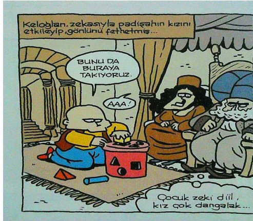
Paylaşım: 6 (URL-6)

Çalışmamızın bu bölümünde Keloğlan'ın sanal kültür ortamlarında nasıl güncellendiğine değinilecektir: