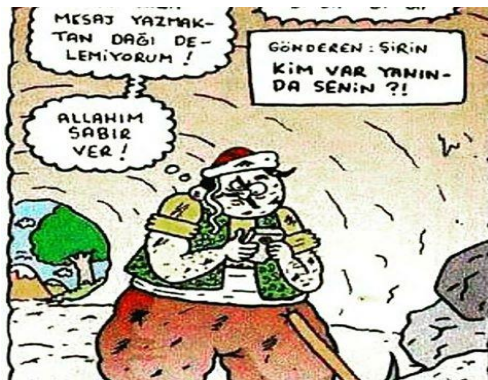
Paylaşım: 21 (URL-23)