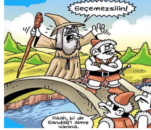
Paylaşım: 16 (URL-17)

Paylaşım 15 ve 16'da da Dumrul'un akıl sağlığının yerinde olmadığı yönünde göndermeler bulunmaktadır. Paylaşım 15'te Dumrul, Yunan mitolojisine dâhil olmak istemekte, fakat “akli dengesi bozuk” olduğu için kabul edilmemektedir. Bu yüzden de kendisine yakıştırılan “deli” sıfatına uygun olarak Yunan mitolojisine ait kahramanları dövme istemektedir. Paylaşım 16'da ise Dumrul, geleneksel rolünün aksine bu kez köprüden geçmek isteyenleri geri çevirmekte ve yanına Yüzüklerin Efendisi filminin karakteri Gandalf'ı da alarak, bir başka deyişle, “deli” olduğunu ispat etmektedir.