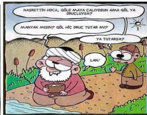
Paylaşım: 2 (URL-2)