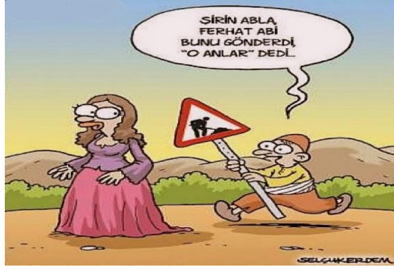
Paylaşım: 23 (URL-25)

Ferhat'ın dağı delme eylemini nasıl gerçekleştirdiğini tasvir eden yukarıdaki paylaşımlar da diğerleri gibi günümüz bağamlarına uyarlanmış, mizah unsuru bu şekilde ortaya çıkmıştır. Paylaşım 21'de Ferhat, Şirin için dağı delmekte; fakat bir yandan da Şirin'in, cep telefonuna gönderdiği kısa mesajlara cevap vermeye ve kıskançlıklarına katlanmaya çalışmaktadır. Paylaşım 22'de ise Ferhat, dağı duvar delme aleti ile delmekte ve Şirin de o esnada elektrikli süpürge ile tozları almaktadır. Paylaşım 23'te de Ferhat, aşkı için dağları deldiği haberini Şirin'e yol çalışması olduğunu işaret eden bir trafik levhası ile ifade etmeye çalışmaktadır.