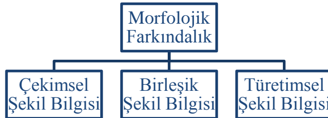
Tablo 1: Morfolojik Bilgi Türleri

Bahsedilen bu morfolojik farkındalık yalnızca çocuklardaki doğal gelişim ve olgunlaşmanın veya konuşulan dile maruz kalmanın bir sonucu olarak gelişmez. Alan yazındaki kaynaklar incelendiğinde, çocuklarda morfolojik farkındalığın gelişiminde rolü olan üç tür morfolojik bilgi türü olduğu belirlenmiştir. Bunlar, çekimsel şekil bilgisi, türetimsel şekil bilgisi ve birleşik şekil bilgisi biçiminde isimlendirilmektedir (Berko, 1958; Carlisle, 2000; Erdem, 2014; Ku ve Anderson, 2003).