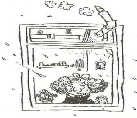
Şekil 1: Yağmurun Oluşumu (Ak, 2016o, s. 22)

Şekil 1’de çocuğun gözyaşıyla yağmur damlaları arasındaki şekil benzerliği vurgulanarak, çocuğun yağmurun oluşumu ile ilgili gerçekliğinin bu benzerlik sayesinde daha da güçlendiği mesajı verilmiştir.