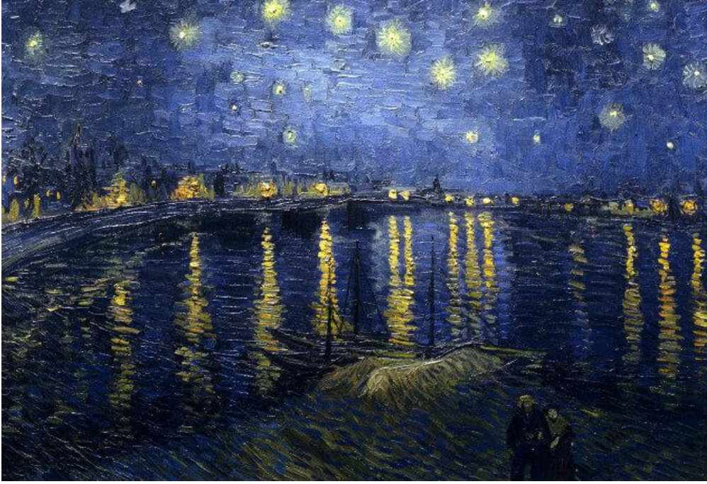
Starry Night Over The Rhone, 1888