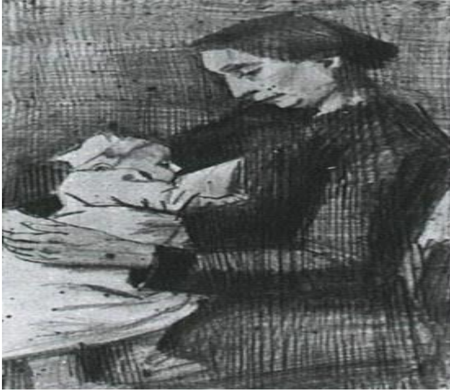
Sien Nursing Baby, 1882