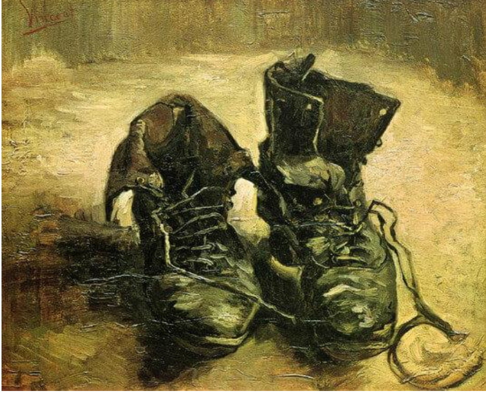
A Pair of Shoes, Paris, 1886