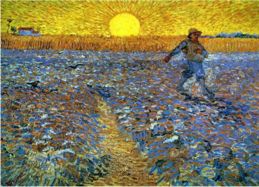
Sower With The Setting Sun, 1888

2. Gdleme: Eđitimcinin đrencilerine ‘‘Bu dersimizde yazı trlerini anlamaya dayalı srelerde beceri kazanacak, yazınsal yapıtların gzel sanatların farklı yapıtlarıyla buluştuđundaki nemini ve gzelliđini kavrayacaksınız; te yandan yazılı anlatımımızda ok nemli bir yeri olan noktalama imlerinin kullanıldıđı yerlerle ve amalarıyla ilgili yeni bilgiler edineceksiniz.’’ demesi. ‘‘Geen dersimizde de sylediđimiz gibi burada grdklerinizi,