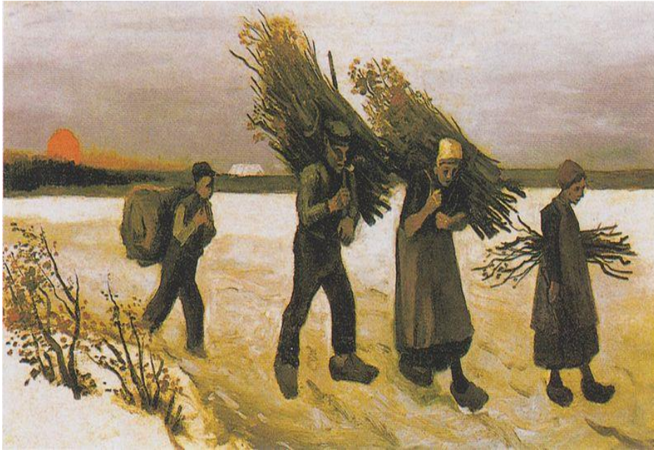
Vincent van Gogh (1884) "Holzsammler im Schnee". Nuenen, September.