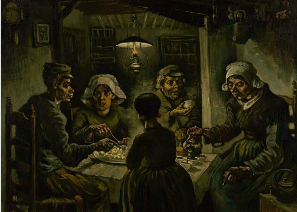
The Potato Eaters, 1885