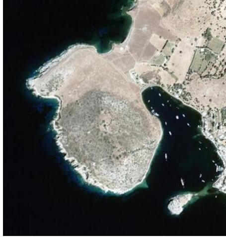
Resim 1: Myndos Antik Kenti'nin uydu görüntüsü.

Myndos Antik kenti günümüzde Muğla İli, Bodrum İlçesi Gümüşlük Beldesi sınırlarında yer almaktadır (Şahin, 2006, s. 171). Antik coğrafyada Karia Bölgesi sınırları içerisinde değerlendirilir. Strabon'dan aldığımız bilgilere göre Myndos Antik Kenti, Kos'un Scandaria burnu karşısında Termerium Burnu üzerinde konumlanmıştır (Strab. XIV. 2.18) (Resim 1).