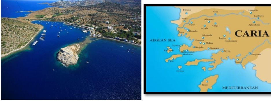
Resim 2 ve 3: Myndos Antik Kenti'nin Coğrafi Konumu ve Haritası.

Coğrafi konum ve sahip olduğu liman yapıları ile Myndos Antik Kenti önemli bir ticari merkez olmuştur (Ekici, 2013, s. 160) (Resim 2-3).