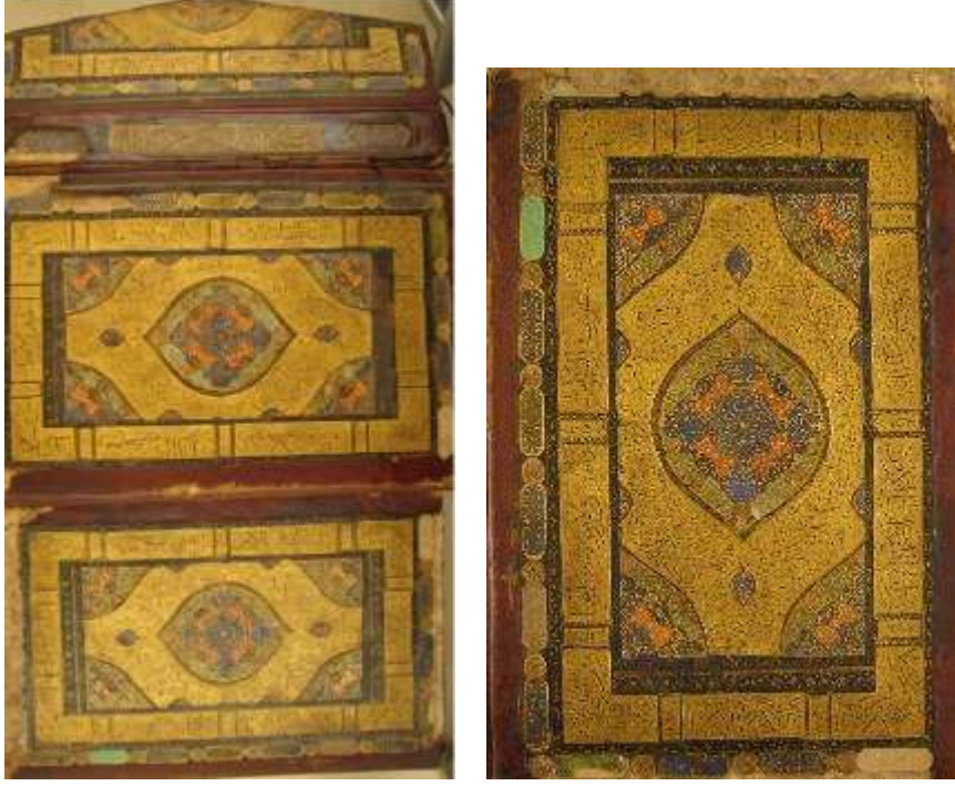
Görsel 2-3: Kur'an-ı Kerim'in Miklepli Cildi 5

altınla ve kırmızı boya ile yine Rûmî motifleri tekrarlanmıştır (Öztürk, 2007, s. 133) 4 . Sayfanın dış bordürü de aynı özellikleri barındırmaktadır. Eserin hatime sayfasında da aynı özellikler gözlenmiş olup kare form içinde sekiz kollu yıldız yer almaktadır.