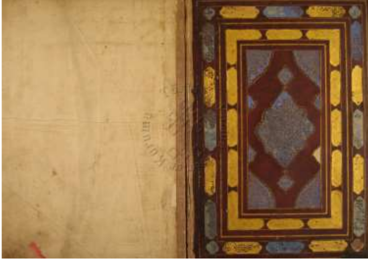
Görsel 10 7