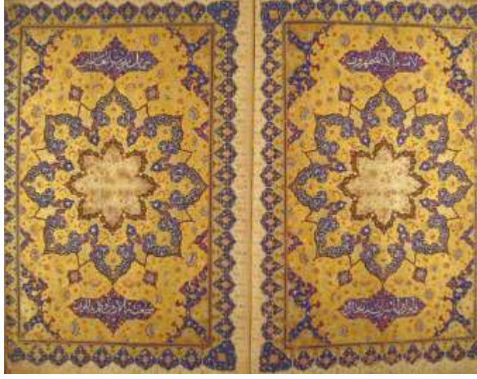
Görsel 4: Zahriye Sayfası

altın renkte, bitkisel ve bulut motiflidir. Aynı bitkisel süsleme sertap kısmında da karşımıza çıkmaktadır. (Kırkkeseli, 2019, s. 79).