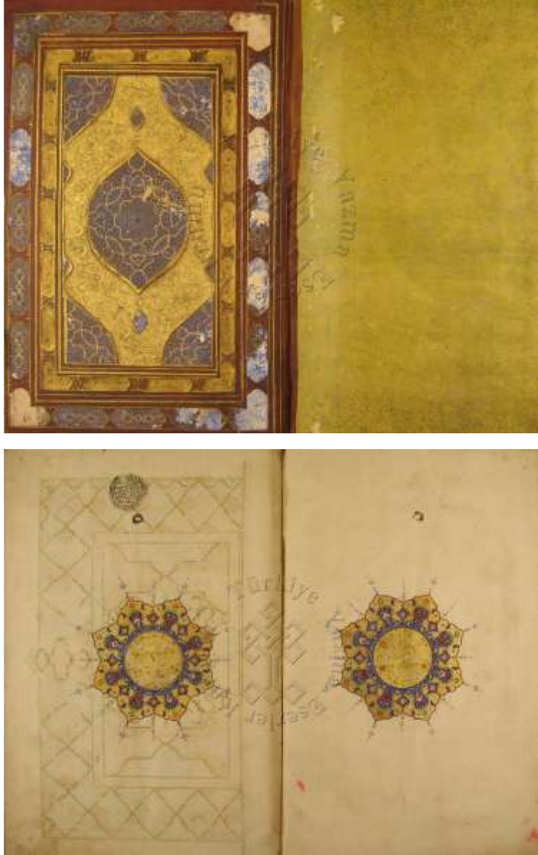
Görsel 8-9 6

Sayfa Kenarları: Ayet gülleri altın yaldızlıdır. Ayrıca çerçevelerin içi motiflerle tezyin edilmiştir. Sure isimleri tezhiplenmiş, her birine farklı bir desen konulmuştur.