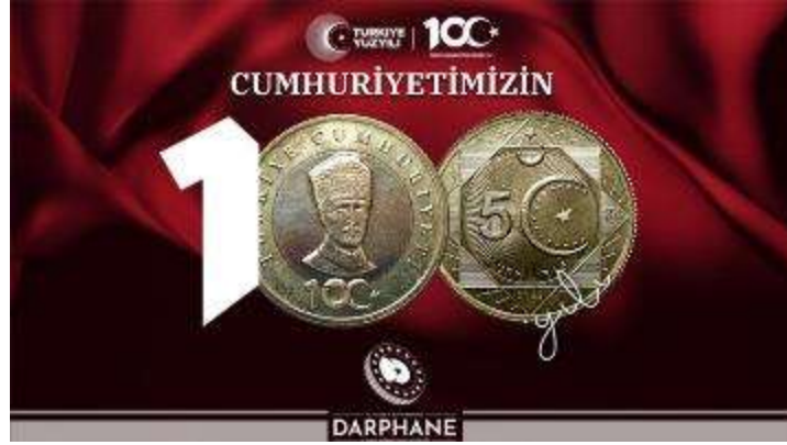
Görsel 20: (URL 8).

29 Ekim 2023 Pazar günü, 5 TL’lik hatıra paralar piyasaya sürülmüştür. Bu paralar, bir defaya mahsus olmak üzere 100 milyon adet basıldığı için hatıra değeri bakımından önemlidir. 100. yıl temalı 5 TL’lik paranın ortasında “Türkiye Yüzyılı” logosu, dış kısmında ise sekiz köşeli Selçuklu yıldızı motifi bulunuyor. Bu motifin dış hatları tekrarlanarak derinlik verilmiştir (URL 9).