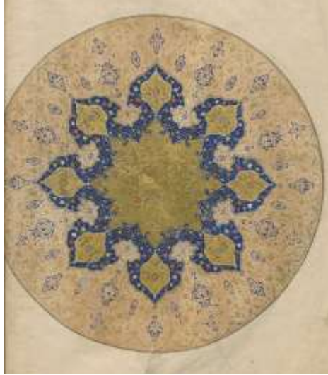
Görsel 12: Zahriye Sayfası

Cilt Özellikleri: Dış ve iç kapaklar kahverengi deriyle kaplıdır. Her iki kapağın merkezinde birer oval şemse, içerisindeki bezeme mavi renkli zemin üzerine uygulanmıştır. Cildin merkezinde dilimli oval şemsenin içi, zemin mavi ile boyalı ortasında sekizgenden oluşan altın renkli kıvrım dallarla süslüdür. Köşebentlerde de aynı kompozisyon devam etmektedir. Her sayfa kenarında yer alan güller sekiz tıgı ve daire formludur.