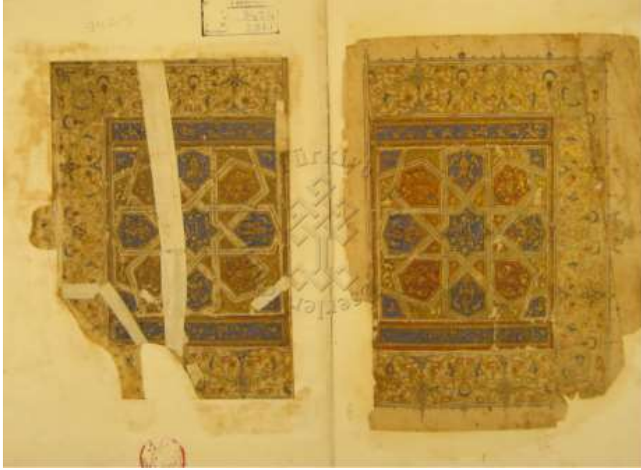
Görsel 1 3