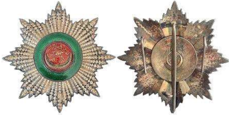
Görsel 14-15: (URL 1-2)

Sultan Abdülaziz, H. 1278 yılında Nişan-ı Osmani'yi ihdas etmiştir. Bu nişan, Osmanlı devlet adamı ve askerlerine üstün hizmetleri için verilen bir ödül olmuştur. Nişan-ı İftihar'dan daha yüksek, Nişan-ı İmtiyaz'dan ise daha düşük bir dereceyi temsil eden, başlangıçta üç sınıf olarak tanımlanan bu nişan, 1867'de dördüncü sınıfa genişletilip ve birinci sınıf, pırlanta veya elmasla süslenmiştir.