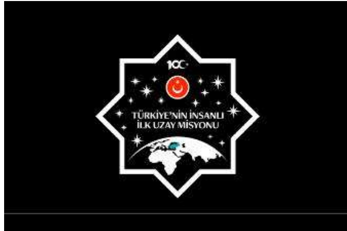
Görsel 21. (URL 10).

Peçin’in en dikkat çekici yerinde yuvarlak bir Türk Bayrağı ve hemen üstünde Cumhuriyet’in 100. yılını simgeleyen “100” sayısı yer alıyor. Etrafında ise 16 yıldız, 16 Türk Devleti’ni temsil ediyor. Yıldızların altında turkuaz renkte bir Türkiye haritası bulunuyor. Ayrıca, Selçuklunun 8 köşeli yıldızı var; bu yıldız, yerle gök arasındaki bağlantıyı ve İslam’ın 8 temel prensibini simgeliyor. Bu unsurlar, armaya bütünlük ve değer katmıştır (URL 10).