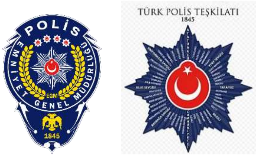
Görsel 16-17: (URL 3)

Türk polis armasındaki “Sekiz Köşeli Yıldız,” ilk olarak Sultan Abdülaziz (1861-1876) döneminde, başarılı kişilere verilen “Nişan-ı Osmani Şemsesi” adlı madalya olarak ortaya çıkmıştır. Sonrasında bu yıldız, Türk polisinin sembolü olmuştur. Yıldızın etrafındaki defne dalı ise başarı ve ünü simgelemektedir (URL 4).