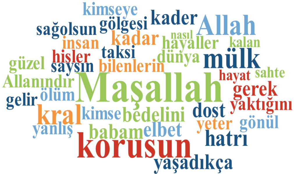
Görsel 3: Araç Yazılarında Öne Çıkan Kelimeler

Bu veriler, araç türleri bazında sosyal ve kültürel analizler için sağlam bir temel sunmaktadır.