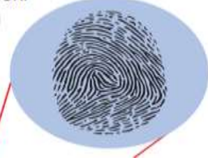
Şekil 1: Bireysel Farklılıklar (Fiziksel Özellikler) ile İlgili Metin (s. 11)

Şu anda dünyada 7,5 milyardan fazla insan yaşamaktadır. Geçmişte yaşayanlar da dâhil olmak üzere bu insanların hepsi biriciktir. Aynı durum doğacak bireyler için de geçerlidir.