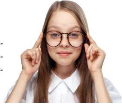
Şekil 2: Bireysel Farklılıklar (İlgi, İhtiyaç ve Yetenek) ile İlgili Metin (s. 19)

İnsanlar fiziksel özellikleriyle olduğu kadar ilgi alanlarıyla da başkalarından ayrılırlar. Ailenizdeki, okulunuzdaki ve yakın çevrenizdeki insanların ilgi alanlarının farklı olduğunu görürsünüz.