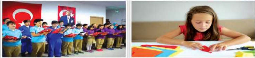
Görsel 6.12: Sosyal ve eğitsel etkinlikler becerilerin geliştirilmesine yardımcı olur.

Şekil 10: Sosyal Katılım ve Demokratik Nitelikler ile İlgili Metin ve Görsel (s. 163)