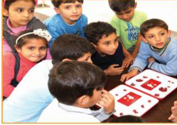
Görsel 1.13: Ülkemizde eğitim gören bir grup misafir çocuk

Konuştuğum çocuklar Türkiye’de buldukları için aslında şanslı olduklarını söylediler de üzüntülerini gizleyemiyorlardı. Bu çok normal bir durumdu. Düşünsenize onların da bizler gibi evleri, parklarında koşup oynadıkları mahalleleri vardı. Okula gidiyor, öğretmenlerini ve arkadaşlarını çok seviyorlardı. Her biri geleceğe yönelik hayaller kuruyor; öğretmen, mühendis, doktor, sanatçı olmak istiyordu. Oysa şimdi bu hayallerinin çok uzağında idiler. Ben kendimi onların yerine koyunca içinde buldukları durumu daha iyi anlıyorum.