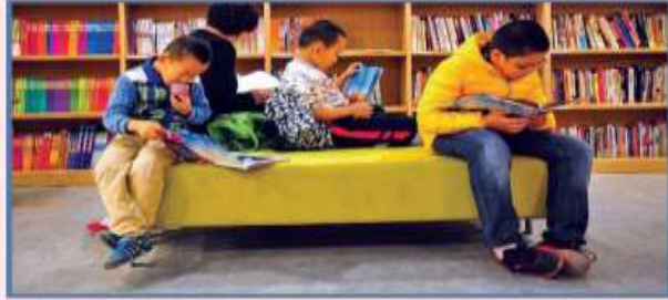
Görsel 6.5: Çocuklar kendilerini geliştirme hakkına sahiptir.

Önemli çocuk haklarından biri de eşitliklerdir. Çocuklar dili, dini, rengi, cinsiyeti veya soyu nedeniyle ayrımcılığa uğramamalıdır. Duygularını ve düşüncelerini serbestçe ifade edebilmeli, başka çocuklarla bir araya gelebilmelidir. Ayrıca kendi kültürünü yaşama hakkından mahrum bırakılmamalıdır.