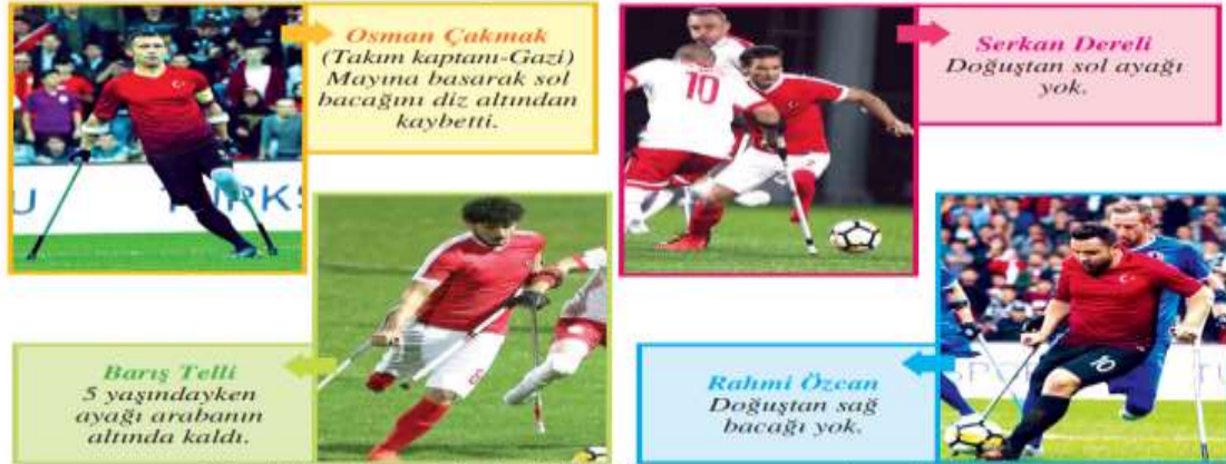
Görsel 1.14: Ampute Futbol Millî Takımımızın oyuncularından bazıları

Bazı insanların önyargılarıyla mücadele eden bedensel engelliler öyle başarılarla imza atıyorlar ki diğer engellilerin moral ve ilham kaynağı oluyorlar. Böylece kendilerini dışlayan insanların kafalarındaki engelli algısının değişmesinde önemli rol oynuyorlar. Bu konudaki en güzel örneklerden biri 2017 yılında ülkemizde yapılan Avrupa Ampute Futbol Şampiyonası'nda yaşandı. Bu şampiyonada Ampute Futbol Millî Takımımız 41 bin kişinin izlediği final maçında İngiltere'yi 2-1 yenerek Avrupa şampiyonu oldu. Şimdi bu takımın bazı oyuncularını yakından tanıyalım (Görsel 1.14).