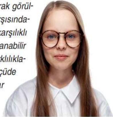
Şekil 14: Farklılıklara Saygı ile İlgili Metin (s. 195)

Ülkeler arasındaki farklılıklar ayrışma, dayatma ve çatışma nedeni değil birer zenginlik kaynağı ve ilerleme aracı olarak görülmelidir. İnsan kendisinden farklı olana saygılı olursa karşısındaki de ona saygı duyar. Aksi hâlde aynı karşılığı alır ve karşılıklı saygı yerini çatışmaya bırakır. Bu nedenle daha yaşanabilir bir dünya için insanlar birbirlerinin doğuştan gelen farklılıklarına saygılı olmalıdır. Farklılıklara saygı gösterildiği ölçüde insanlar arasındaki düşmanlık duyguları ve ön yargılar ortadan kalkar. Böylece barışın ve sevginin hâkim olduğu, insan onurunu yücelten bir dünya kurulur.