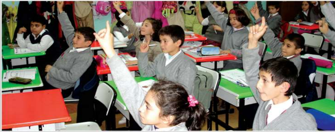
Görsel 6.1: Eğitim alma her çocuğun hakkıdır.

4. sınıf “İnsanlar ve Yönetim” ünitesi “Ben Çocuğum, Haklarımla Varım” başlığı altında çocuk haklarından biri olan “eğitim hakkı” konusunda farkındalık yaratmak amacıyla aşağıdaki (Şekil 8) görsel verilmiştir.