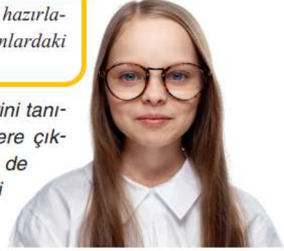
Şekil 13: Kültürel Farklılıklara Karşı Saygılı Olma ile İlgili Metin (s. 188)

Tarih boyunca insanlar gezip görmek, yeni birilerini tanımak, dinlenmek, eğlenmek gibi amaçlarla seyahatlere çıkmışlardır. Gezmek geçmişte olduğu gibi günümüzde de önemli bir ihtiyaçtır. Bu nedenle insanlar farklı ülkeleri gezerek meraklarını giderip bilgilerini artırmaya çalışırlar. Turizm adı verilen bu faaliyetler genellikle seyahat şirketleri tarafından yürütülür. Bu kuruluşlar insanlara gidecekleri ülkeleri önceden tanıtmak amacıyla görsel ve yazılı iletişim araçlarını kullanırlar. Ülkelerin özelliklerini anlatan genel ağ siteleri kurarlar. Gezi dergileri ve tanıtım broşürleri hazırlayıp insanları gezmeye teşvik ederler. Aşağıda bu broşürlerden alınmış bazı bölümler görüyorsunuz.