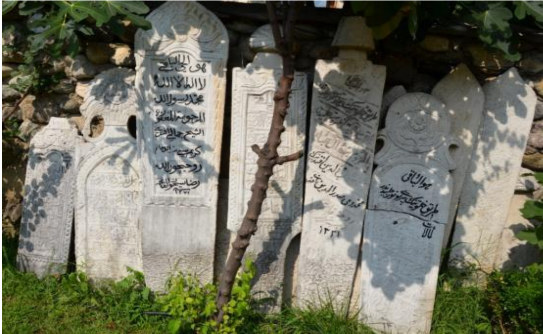
Foto 20: Mehmet Paşa Camisi (Bayraklı Cami) bahçesindeki mezar taşlarından bir kısmının görüntüsü (Priştine - Kosova) 6