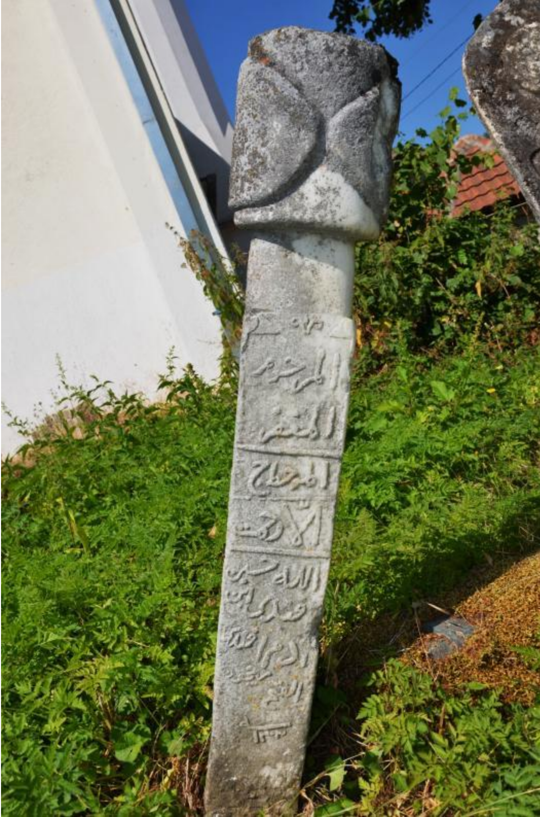
Foto 8: Melike Köyü Merkez Camisi'nin haziresindeki mezar taşlarından birinin görüntüsü (Gora – Kosova)