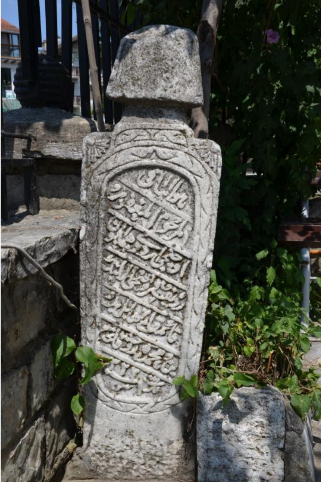
Foto 7: Maksut Paşa (Maras) Camisi'nin haziresindeki mezar taşlarından birinin görüntüsü Prizren - (Kosova)