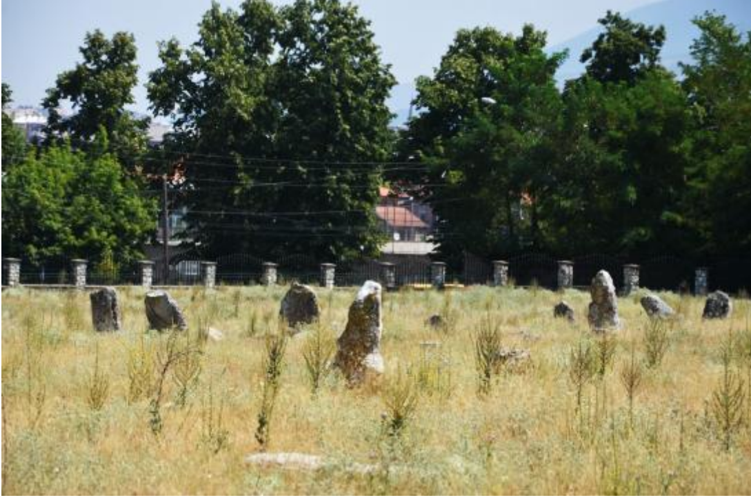
Foto 27: Karabaş Mezarlığı'ndaki mezar taşlarının genel bir görüntüsü