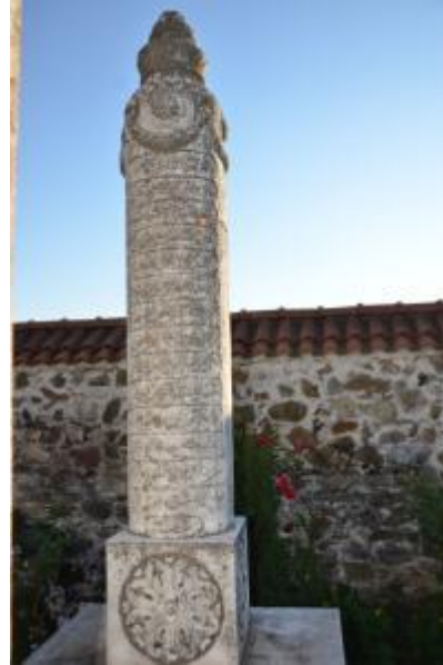
Foto 9-10: Hafız Mehmed Paşa'nın kabrinin ve mezar kitabesinin görüntüsü (Priştine – Kosova)