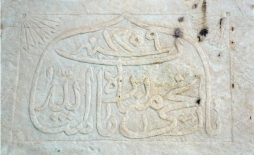
Foto 45: Aynı caminin minaresi üzerindeki kitabenin bir görüntüsü