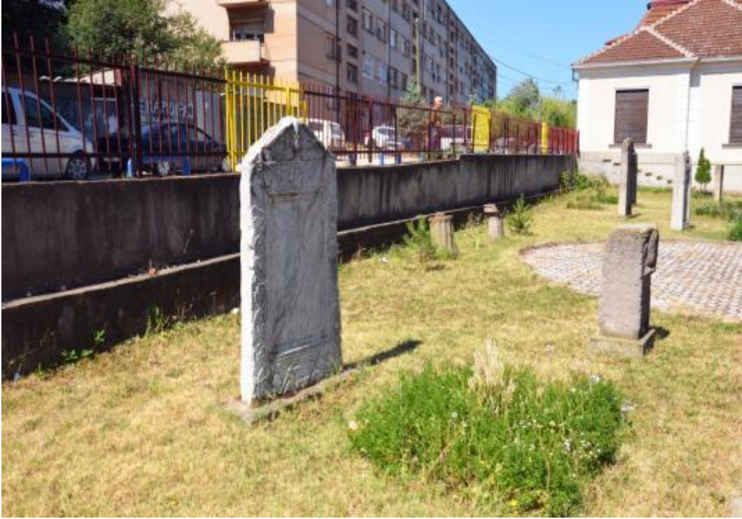
Foto 1: Kumanova Müzesinin bahçesinde sergilenen mezar taşlarının genel görüntüsü 3

Bugün gelinen noktada Kuman / Kıpçak döneminden kalan çok az arkeolojik eserle birlikte bazı anıtsal mezar taşlarının müzelerde teşhir edildiklerini kaydetmek mümkündür. Makedonya Cumhuriyeti'nin Kumanova Bölgesi'ndeki müzede yer alan arkeolojik buluntular ve mezar taşları Türklerin bu bölgedeki tarihine, yaşayışına ve inanışına ışık tutacak bilgileri içermektedir. Farklı dil ve alfabelerle yazılmış Kuman / Kıpçak mezar taşlarının neredeyse tamamı örtüsüz ve korunaksız durumdadır.