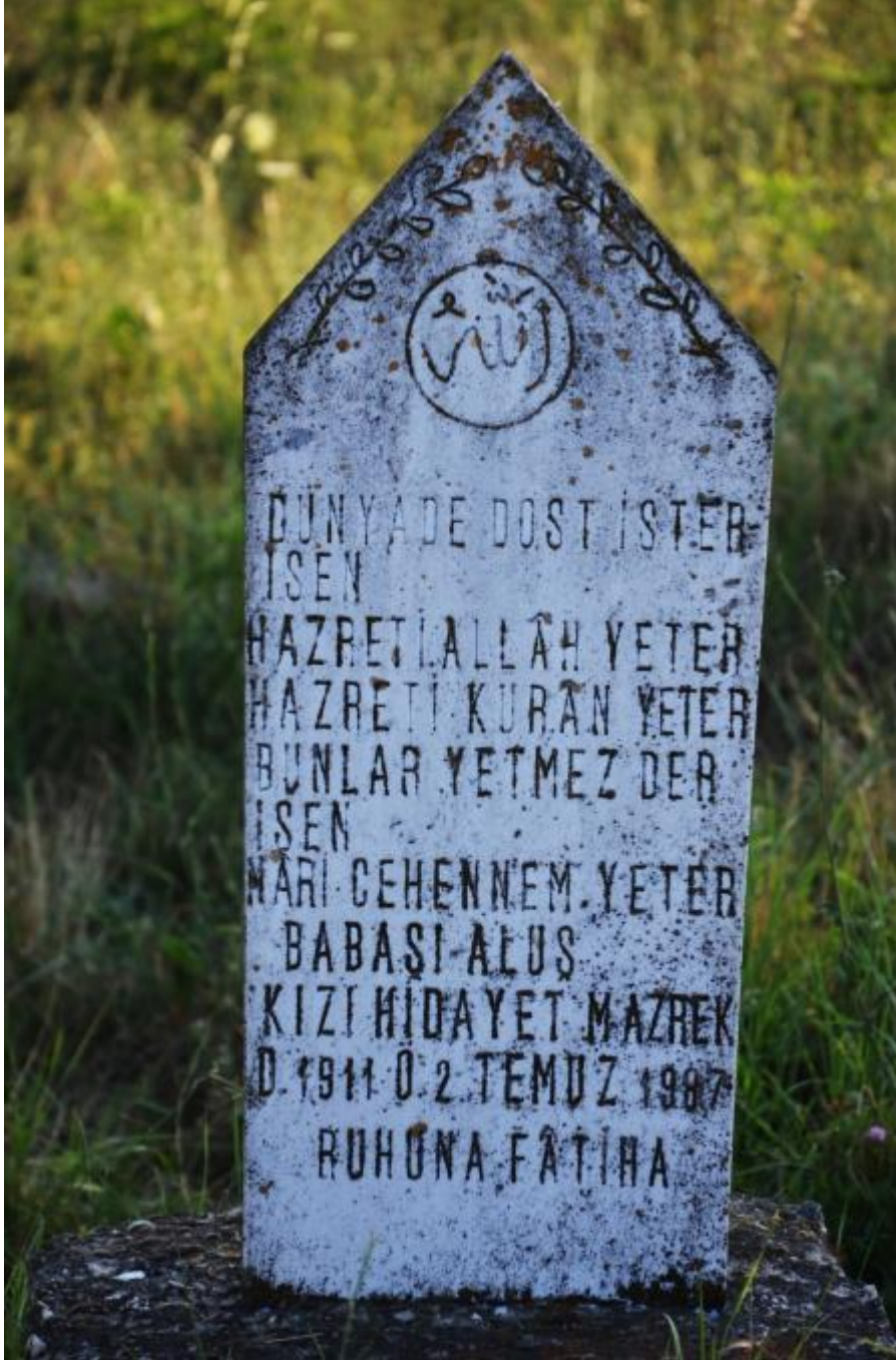
Foto 39: Mamuşa (Kosova) Mezarlığı’ndaki mezar taşlarından birinin görüntüsü

Kosova ve Makedonya’da Türk ve Müslüman ahaliye ait pek çok mezar bulunmaktadır. Bu mezarlıklardaki mezarların ve mezar taşlarının Türklere ait olanları (şekil ve içerik özellikleri bakımından) Anadolu’daki mezarlıklardan farklı değildir.