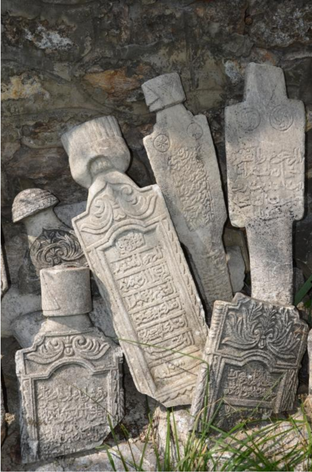
Foto 18: Mehmet Paşa Camisi (Bayraklı Cami) bahçesindeki mezar taşlarından bir kısmının yakın görüntüsü (Pristine - Kosova)