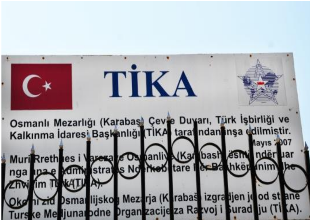
Foto 26: Karabaş Mezarlığı'nın çevre duvarının TİKA tarafından yapıldığını belirten tabelanın görüntüsü