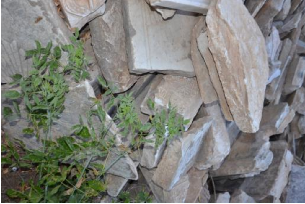
Foto 14: İshak Çelebi Camisi'nin haziresindeki parçalanmış mezar taşlarına ait bir görüntü