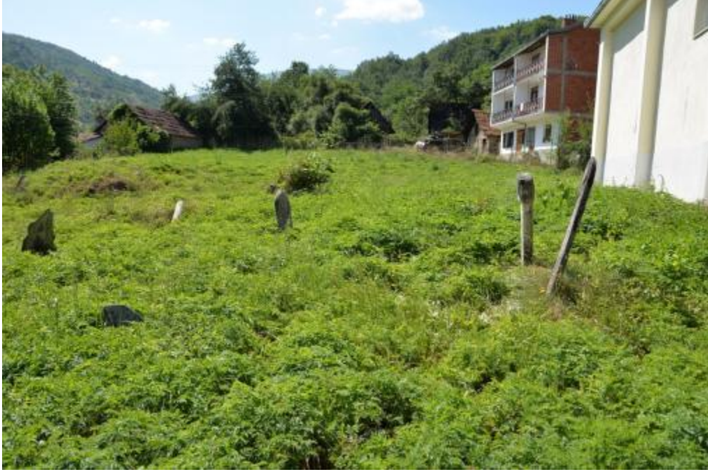
Foto 21: Melike Köyü Merkez Camisi'nin haziresinden bir görüntü (Gora – Kosova)

Kosova'da ve Makedonya'da hazirelerde bulunan; yok edilmekten ve parçalanmaktan kurtulup ayakta duran mezar taşlarının büyük bölümü de otlar ve ağaçlar arasında âdeta kaybolmuş; yazılı yüzeylerini yosunlar ve likenler kaplamıştır.