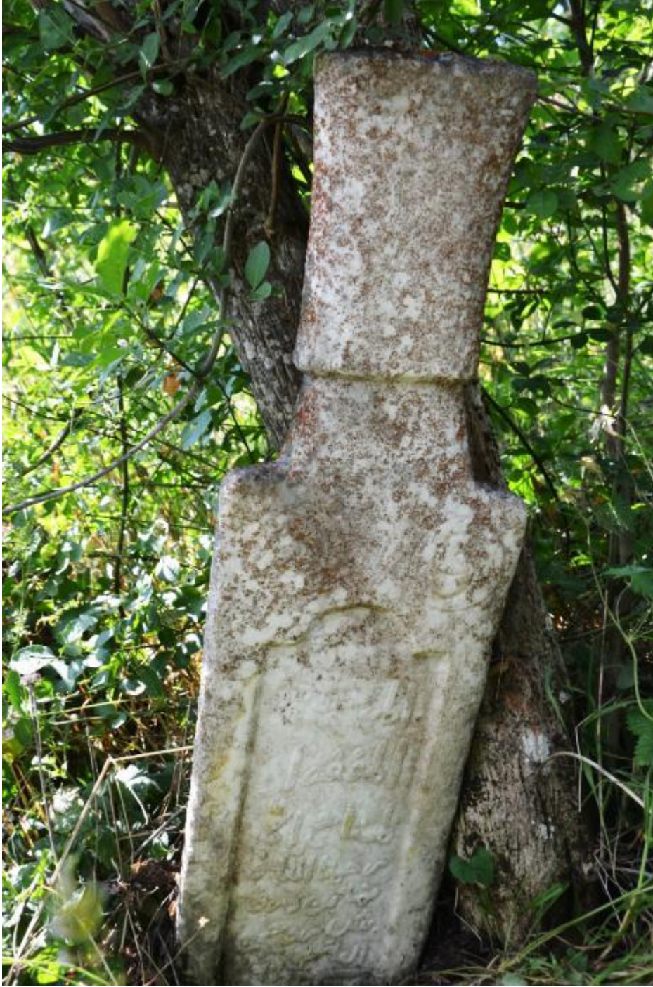
Foto 31: Başka Köyü Mezarlığı'ndaki mezar taşlarından birinin görüntüsü

Yerleşim yerlerine uzak bölgelerdeki mezarlıklarda bulunan mezar taşları diğerlerine oranla daha sağlam kalmış olsalar da bu mezar taşlarının da büyük bölümü restorasyona ve konservasyona muhtaçtır.