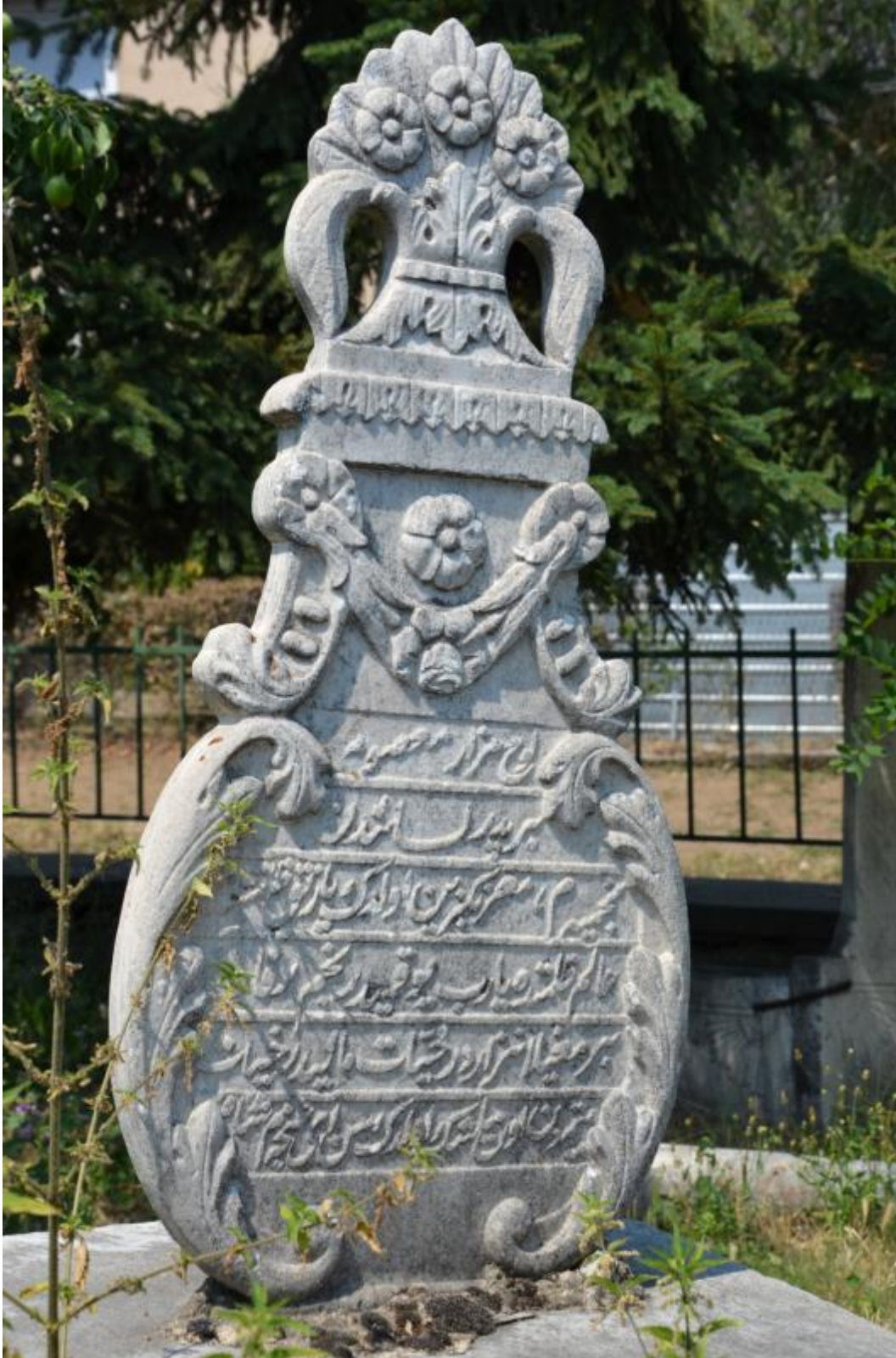
Foto 4: Manastır'da Hasan Baba Camisi'nin haziresindeki mezar taşlarından birinin görüntüsü