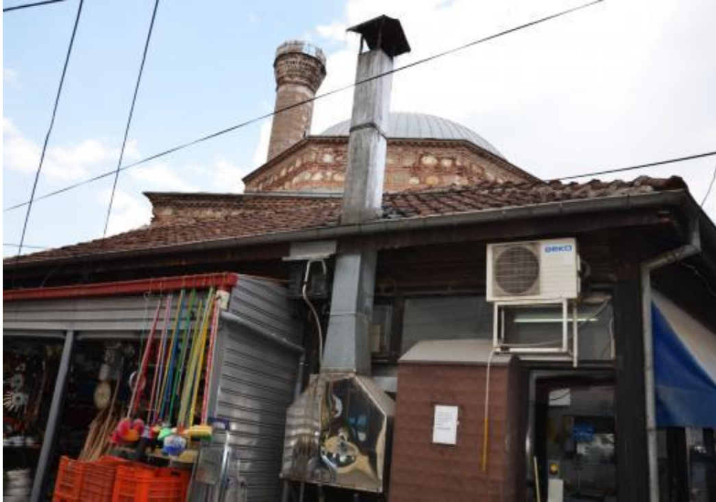
Foto 46: Bir kısmı dükkân, bir kısmı ardiye olarak kullanılan Manastır'ın merkezinde bulunan Çarşı Camisi'nin genel görüntüsü