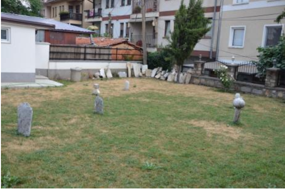
Foto 11: Ali Paşa Camisi haziresinde büyük bölümü yok olan mezar taşlarının genel görüntüsü (Ohri – Makedonya)

Anılan bütün bu özelliklerine ve önemlerine rağmen hazirelerdeki mezar taşlarının büyük bölümü ne yazık ki korumasız ve korunaksız durumdadır. Osmanlı Dönemi'nin sona ermesi, hazirelerdeki mezarlarla / mezar taşlarıyla ilgili ailelerin önemli bir kısmının yaşanan baskılar yüzünden başka bölgelere göç etmeleri, komünist rejimin hüküm sürdüğü dönemlerde camilere, tekkelere, zaviyelere ve türbelere giriş çıkışların yasaklanmış olması, mezarların ve mezarlıkların önemli bir kısmının bakımsızlık ve ilgisizlik yüzünden ya tamamen yok olup gitmesine veya parçalanmasına sebep olmuştur.