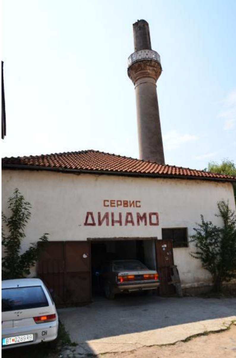
Foto 44: Bugün otomobil tamirhanesi olarak kullanılan Osmanlı Dönemi’ne ait bir caminin görüntüsü (Çınar Mahallesi, Manastır / Makedonya)

Kosova ve Makedonya’da mezar taşları dışında camilerin, minarelerin, medreselerin, tekkelerin, zaviyelerin, türbelerin, hanların, kervansarayların, köprülerin, konakların vd. mimarlık eserlerinin üzerlerinde de yazıtlar / kitabeler bulunmaktadır. Söz konusu yazıtlar genelde üzerlerinde buldukları eserle aynı kaderi paylaşmışlardır. Nitekim bölgede yaşanan savaşlar, göçler ve yönetim değişiklikleri Osmanlılara ve onların temsilcisi durumundaki Osmanlı Dönemi eserlerine karşı bir tepki oluşturmuş; bu eserler ya yapım amaçları dışında kullanılabilir hâle gelmişler; ya kaderlerine terk edilmişler; ya da tamamen ortadan kaldırılmışlardır.