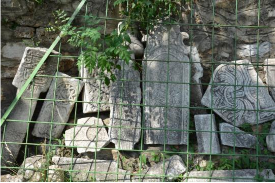
Foto 19: Mehmet Paşa Camisi (Bayraklı Cami) bahçesindeki mezar taşlarından bir kısmının görüntüsü (Priştine - Kosova)