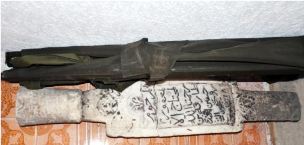
Foto 38: Melike Köyü Merkez Camisi'nin deposundaki mezar taşlarından biri (Gora – Kosova)