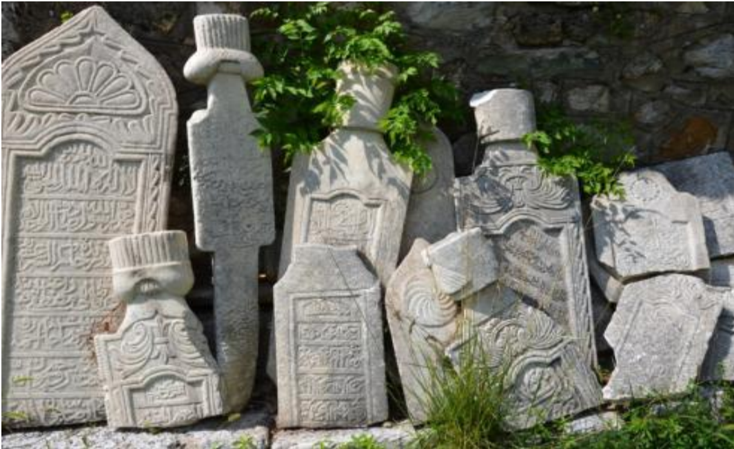
Foto 17: Mehmet Paşa Camisi (Bayraklı Cami) bahçesindeki mezar taşlarından bir kısmının görüntüsü (Priştine - Kosova)