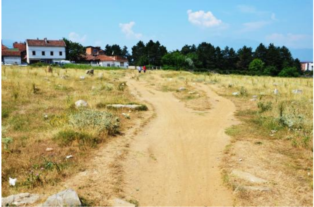
Foto 28: Karabaş Mezarlığı'nın üç ayrı noktasından geçen yollardan birinin görüntüsü