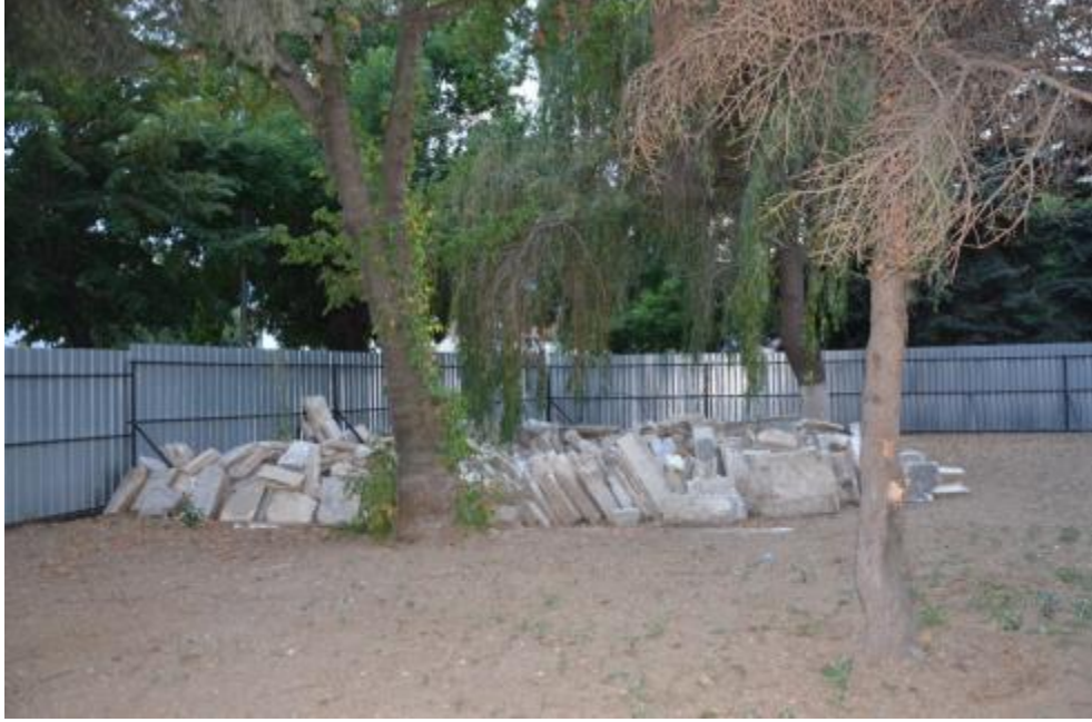
Foto 12: Manastır'daki İshak Çelebi Camisi'nin haziresinde tamamen yok edilen mezarlara ve mezar taşlarına ait alandan bir görüntü

Bazı camilerin, tekkelerin ve zaviyelerin hazirelerinde bulunan mezarlar VİRMİÇA'nın da belirttiği gibi farklı sebeplerle (bazen de bilerek ve isteyerek) kısmen veya tamamen yok edilmiş; bu mezarlara ait mezar taşları da camilerin, tekkelerin bahçelerine vd. yerlere toplanmıştır.