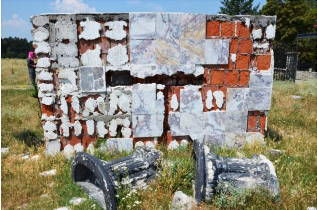
Foto 30: Karabaş Mezarlığı'nda 2007 yılında yapılan çeşmenin bugünkü durumu