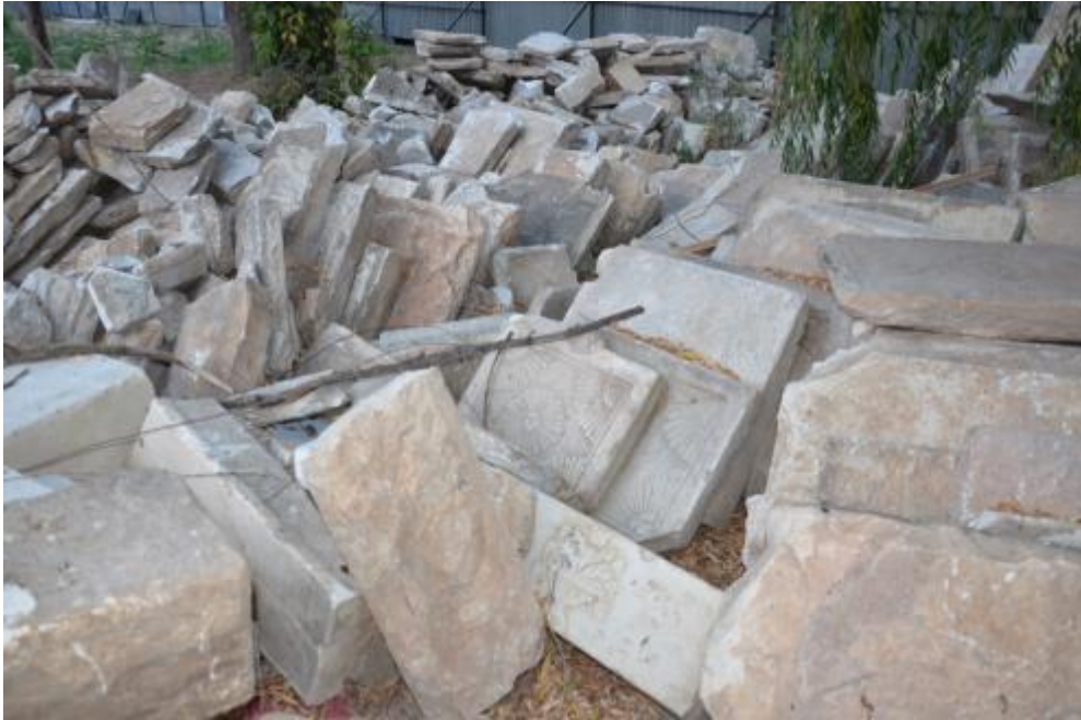
Foto 13: İshak Çelebi Camisi'nin haziresindeki parçalanmış mezar taşlarına ait görüntü