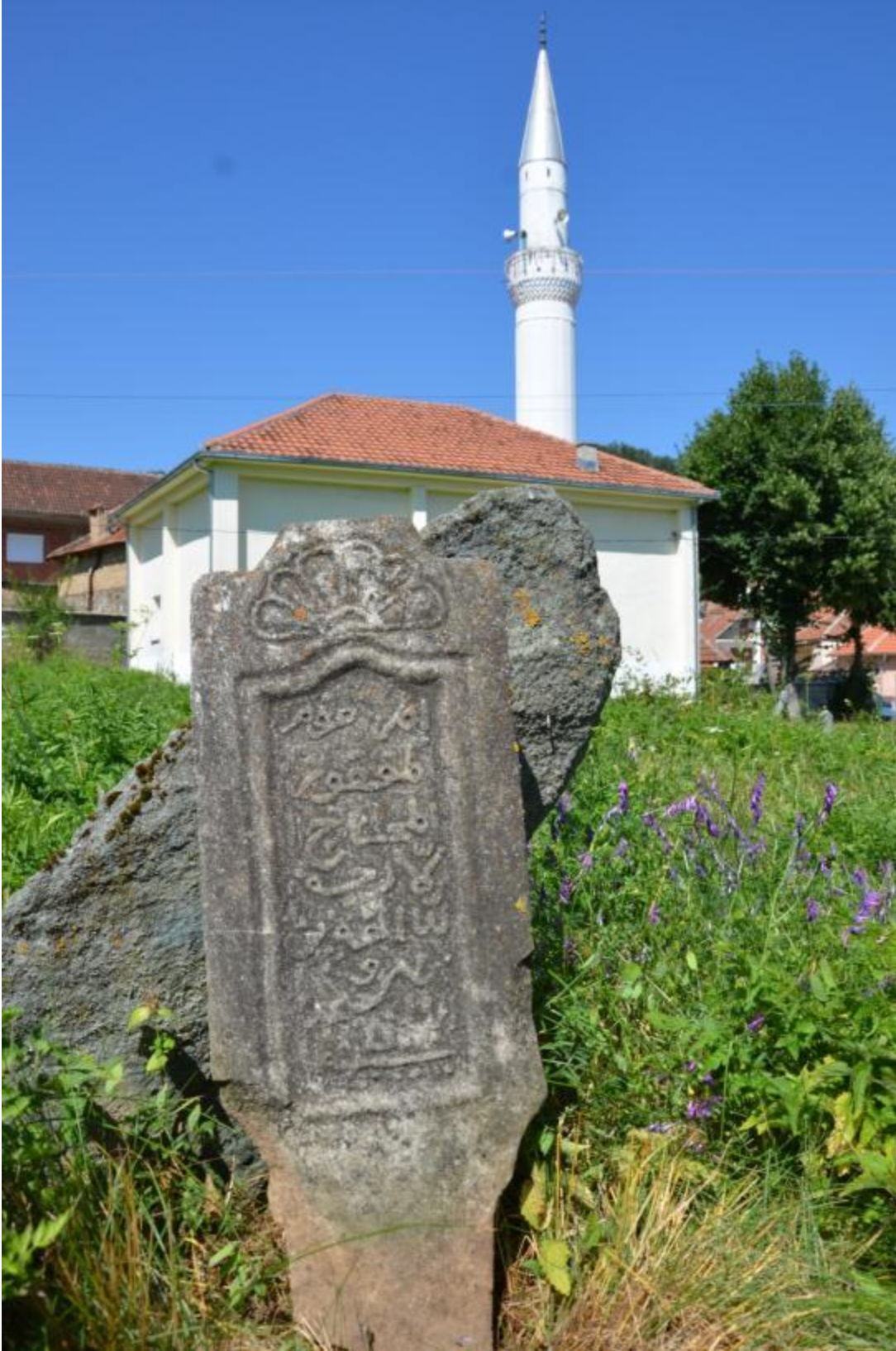
Foto 23: Melike Köyü Merkez Camisi'nin haziresinde orijinal görüntüsünü kaybetmiş mezar taşlarından biri (Gora – Kosova)