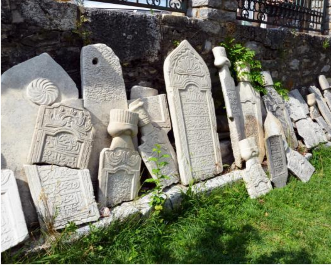
Foto 16: Mehmet Paşa Camisi'nin (Bayraklı Cami'nin) haziresinde orijinal yerlerinden çıkartılıp bahçe duvarının önüne dizilmiş mezar taşlarından bir kısmının görüntüsü (Priştine - Kosova)