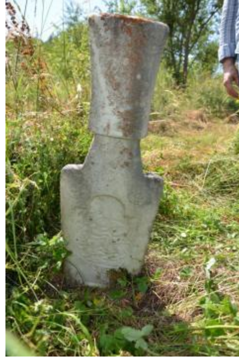
Foto 32-33: Bačka Köyü'ndeki bir mezar taşının (önce ve sonrasına ait) görüntüleri (Gora – Kosova)