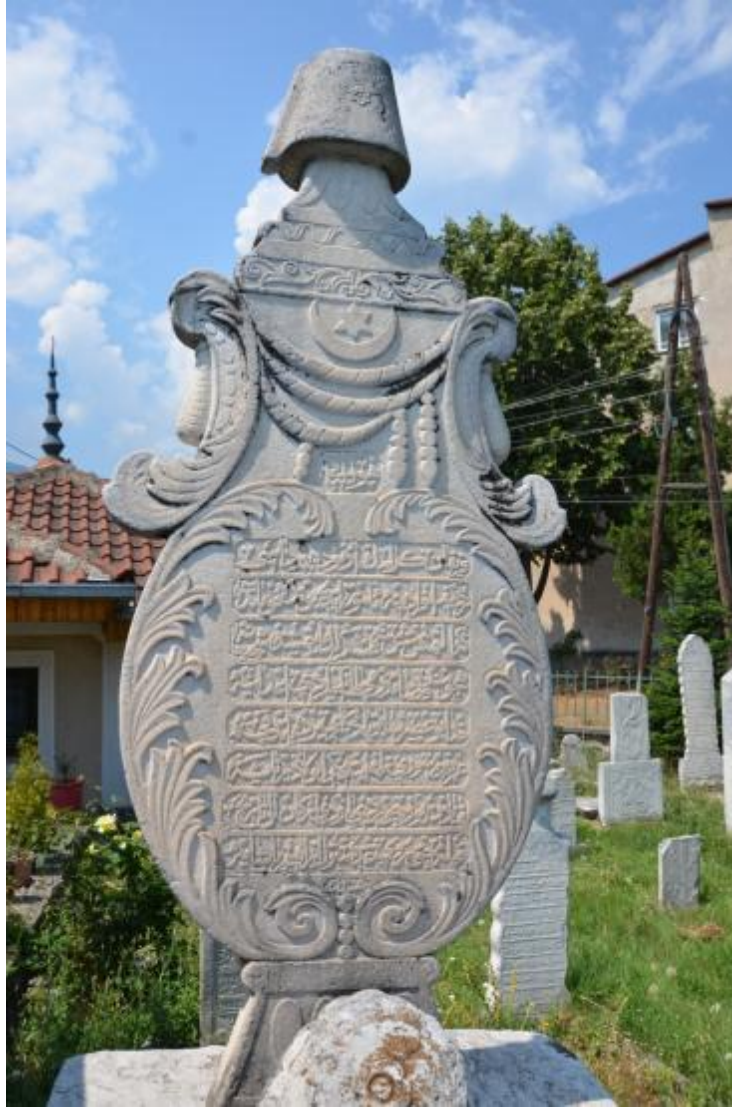
Foto 3: Manastır'da Hasan Baba Camisi'nin haziresindeki mezar taşlarından birinin görüntüsü

Bütün Osmanlı coğrafyasında olduğu gibi Kosova ve Makedonya'daki camilerin, tekkelerin, zaviyelerin ve türbelerin hazirelerinde bulunan mezarların sandukaları da mezar taşları da özenle yapılmışlardır. Bu mezarların ve mezar taşlarının her biri yapım teknikleri, içerikleri, üzerlerinde barındırdıkları epigrafik ve grafik öğeler (yazılar, damgalar, semboller, süsleme ve bezemeler) bakımından tek tek ele alınıp incelenecek nitelikte ve değerlidirler. Her biri ait oldukları dönemlerin "hafızası" niteliğindeki bu mezar taşları Türkiye'deki ve Türk Dünyası'nın farklı bölgelerindeki (Bakü'deki, Şamahı'daki, Gence'deki, Erzurum'daki, İstanbul'daki, Edirne'deki, Bursa'daki...) Arap harfli, tasvirli ve işlemeli mezar taşlarıyla da büyük benzerlikler gösterir. Büyük bölümü yontma ve kabartma tekniğiyle yapılan mezar taşlarının sarıklı, fesli, şahideli, şahidesiz, tepelikli, tepeliksiz vd. olanları mevcuttur.