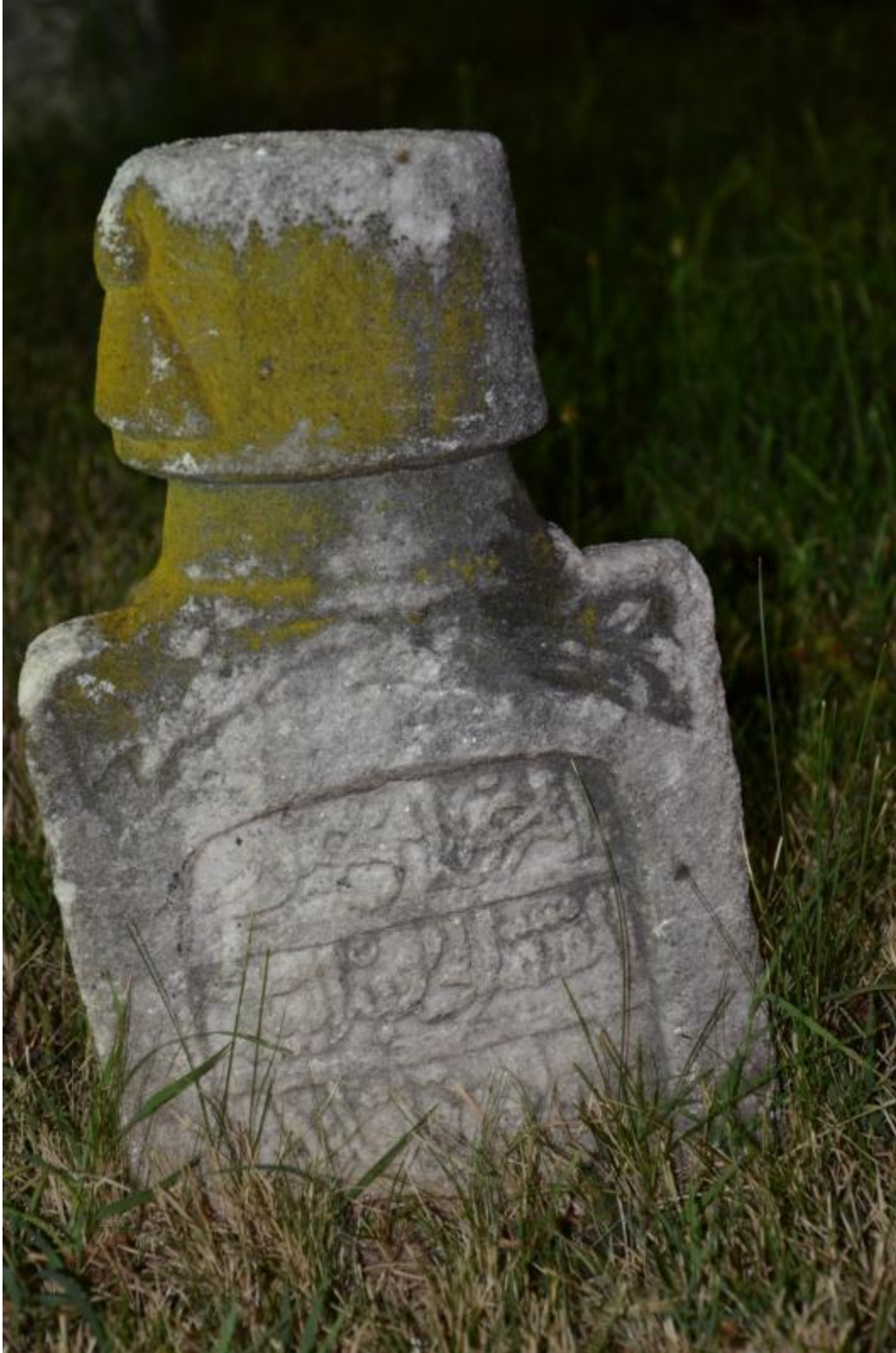
Foto 24: Alaca Cami'nin haziresinde üzeri yosun ve likenlerle kaplı bir mezar taşının görüntüsü (Tetova / Kalkandelen – Makedonya)