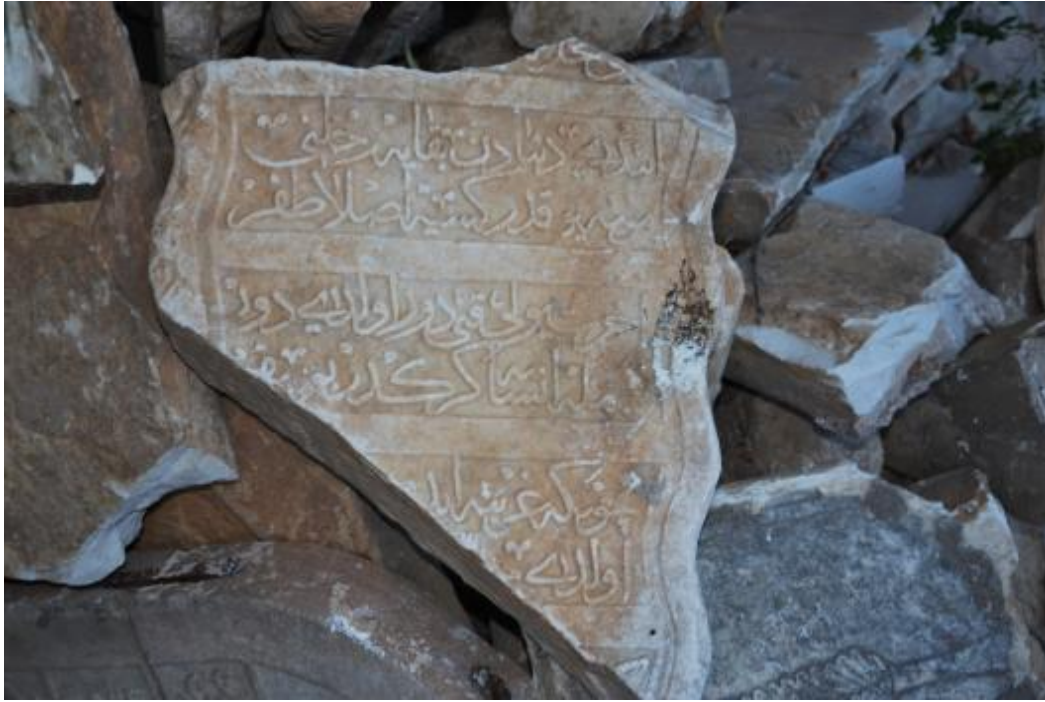
Foto 15: İshak Çelebi Camisi'nin haziresindeki parçalanmış mezar taşlarından birine ait görüntü