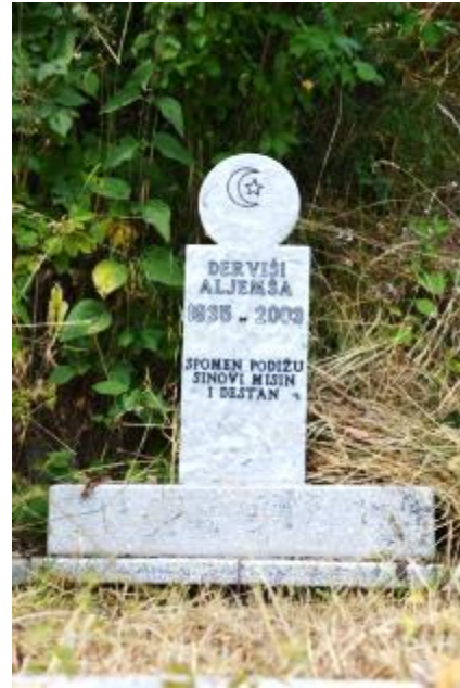
Foto 42-43: Bačka Köyü Mezarlığı'ndaki mezar taşlarından görüntüler (Gora – Kosova)