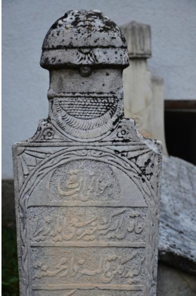
Foto 6: Pir Muhammed Mehmed Hayatî Halvetî Dergâhı'nın haziresindeki mezar taşlarından birinin görüntüsü (Ohri - Makedonya)

Kosova ve Makedonya'daki hazirelerde bulunan Osmanlı Dönemi mezar taşları genellikle Hüve'l - Bâkî , Hüve'l - Hayyü'l - Bâkî , Hüve'l - Hallâku'l - Bâkî , el Bâkî , el Hükmülillâh... ifadelerini; mezarın kime ait olduğuna dair bilgileri ( el merhûm ve el mağfûr ... ; el merhûm el mağfûr el muhtâc... ; el merhûme el mağfûre ... ), merhumun / merhumenin ölüm tarihini ( sene / fi sene ... ) ve dua / Fâtiha isteğini (... ruhu için el Fâtiha ; ... ruhiyçün el Fâtiha , ... ruhiyçün Fâtiha , ... ruhuna el Fâtiha , .... ruhuna Fâtiha ) ifade eden kalıplaşmış dil öğelerini içermektedir.