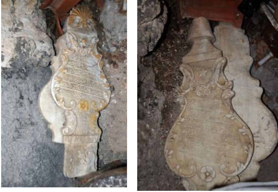
Foto 36-37: Brod Köyü Çarşı Camisi'nin deposunda bulunan mezar taşlarının görüntüleri (Gora – Kosova)

Kosova ve Makedonya'daki camilerin, tekkelerin, zaviyelerin ve türbelerin hazirelerinde veya mezarlıklarda bulunan bazı mezar taşları buldukları yerlerden alınarak korunmak veya teşhir edilmek amacıyla depolara veya müzelere taşınmışlardır. Söz konusu mezar taşlarının hangi hazireden veya hangi mezarlıktan getirildiklerine dair envanter kaydı da tutulmamıştır.