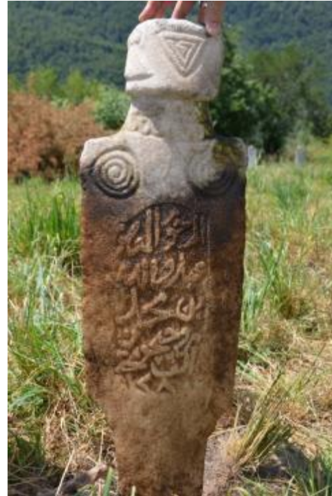
Foto 34-35: Globocica Köyü Mezarlığı'nda yazılı yüzeyi toprak altında kalmış bir mezar taşının (önce ve sonrasına ait) görüntüleri (Gora – Kosova)